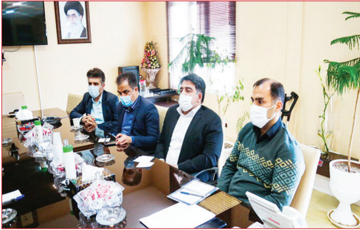
اشاره کرد و افزود: این سامانه پیشرو و مدرن که از طریق اعتبارات سفر مقام

وجود دارد که تقریبا در تمام پهنه استان پراکندگی دارد هر چند در شرق استان از این نظر با کمبودهایی مواجه هستیم. وی به سامانه و شبکه هشدار سیل