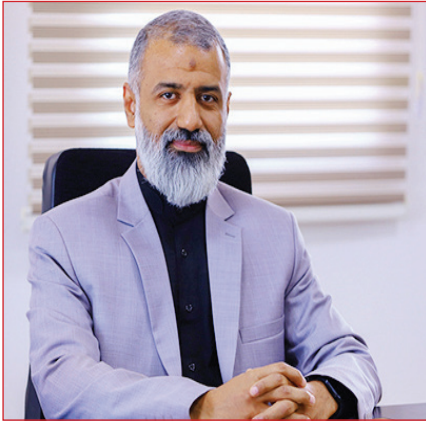
بر متخصصان سازمان، از نخبگان حوزه فناوری نیز برای حضور در این جلسات دعوت می‌شود و

سرپرست سازمان فناوری اطلاعات و ارتباطات شهرداری قم توجه به درآمدزایی سازمان را پس از استقلال آن مهم ارزیابی کرد و گفت: در کنار سرویس‌هایی که باید در کمترین زمان در اختیار