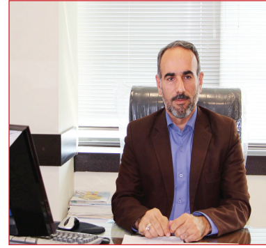
در ابتدا نمایی کوتاه از وضعیت کشاورزی قم ارائه دهید

همزمان با سال جاری و با ورود علم به مزارع کشاورزی قم و هم‌چنین بهره‌گیری از هشت پهپاد در سم پاشی تا ۲۰ درصد از میزان خسارت در مزارع استان کاسته شد. بر کسی پوشیده نیست که قم یک استان کوچک با منابع محدود آبی و کوپری سخت است که کشاورزان این استان با هزاران زحمت انواع محصولات کشاورزی را تولید می‌کنند. از سویی برای همه جای سؤال است که مگر می‌شود در استانی که محدودیت منابع آبی در آن زیاد می‌کنند و اقلیمی سخت و شکننده دارد می‌توان محصولی را تولید کرد؟ آری کشاورزان قمی با مدیریت در مصرف آب و هم‌چنین تغییر سیستم آبیاری توانستند تا حدودی بر مشکلات کوپری پیروز و در زمینه تولید انواع محصولات زراعی و باغی موفق باشند.