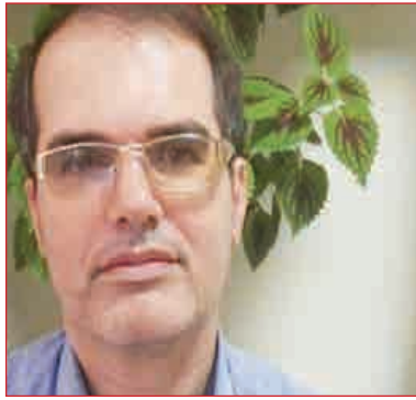
مکی در گفت‌وگویی که میان لاوروف و بلینکن برگزار شد یک نشانه از این بود که آمریکا از حالت سیاست تنش‌آفرینی فاصله گرفته و شاید سیگنالی باشد که در پیش اعلام کرد که آمریکایی‌ها مسئول انفجار خط لوله نورد استریم هستند، ما شاهد بودیم که برخی کشورهای اروپایی به خصوص آلمان برای قطع واردات گاز از روسیه ملاحظاتی داشتند که آمریکا عملاً با این اقدام آن‌ها را در

مکی افزود: به نظر نمی‌رسد این مواضع در خصوص عوامل خط لوله نورد استریم بتواند کمکی به روسیه ایفا کند چرا که اصل حمله روسیه به اوکراین و نبردی که زیرساخت‌های اوکراین را هدف گرفته جایی برای این گونه سخنان مسکو باقی نگذاشته است.