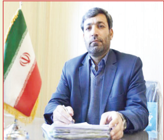
معاون دادستان قم گفت: در سال گذشته، ۲ هزار و ۷۴۰ خانواده با مراجعه به دادسرای انقلاب و طرح شکایت از عضو از خانواده خود که به مصرف مواد مخدر معتاد است، کمپ‌های ذیل تبصره ۲ ماده ۱۶ جهت اقدامات درمانی و ترک اعتیاد معرفی شده‌اند.

معاون دادستان قم در ادامه، در خصوص ویژگی‌های بیماران معرفی شده به کمپ‌های ترک اعتیاد بر اساس اطلاعات سال گذشته گفت: ۹۷ درصد از آنها مرد و ۳ درصد خانم هستند. بیشترین بیماران معرفی شده به کمپ در سن ۳۰ الی ۴۰ سال بوده و ۱۰ درصد این افراد کمتر از ۲۵ سال سن دارند. بر خورد با خرده فروشان مواد مخدر نیز گفت: در بحث مبارزه با خرده فروشان مواد مخدر در سال گذشته، یک هزار و ۷۲۱ مورد حکم ورود و بازرسی از منازل صادر که مقادیر قابل توجهی مواد مخدر در همین بازرسی‌ها کشف و ضبط شد.