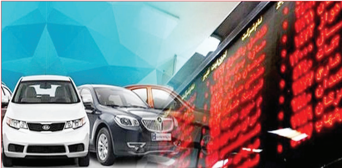
سخنگوی صنعت برق عنوان کرد:

در سیستم نوبت دهی، خودروهای داخلی و مونتاژی بر اساس قیمت دستوری ابلاغ شده از سوی شورای رقابت فروخته می شوند و با توجه به وضعیت زیاندهی شرکت ها، خودروسازان به ویژه مونتاژکاران تمایلی به استفاده از این سیستم و قیمت های دستوری ندارند و ترجیح می دهند محصولات خود را با قیمت های که از طریق رقابت در بورس کالا تعیین می شود بفروشند تا ضمن دور زدن قیمت گذاری دستوری، خودروها را با قیمتی نزدیک به قیمت بازار بفروشند.