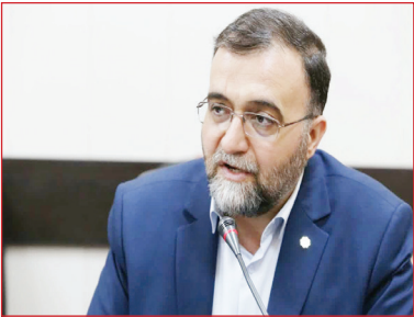
معاون شهردار قم:

وی با تأکید بر اینکه کمیته‌ای برای تهیه محتوا تشکیل و دو رنگ طلایی و فیروزه‌ای برای شهر قم انتخاب شد، اضافه کرد: ۸ جلوه زیارتی، تمدنی، انقلابی، علمی پژوهشی، ایثار و شهادت، فرهنگی هنری، گردشگری و بین‌المللی برای استان قم در نظر گرفته‌شده است. ▶