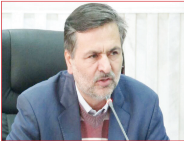
رئیس جهاد کشاورزی سمنان

مقررات موازی را در حوزه زمین در پایان سال