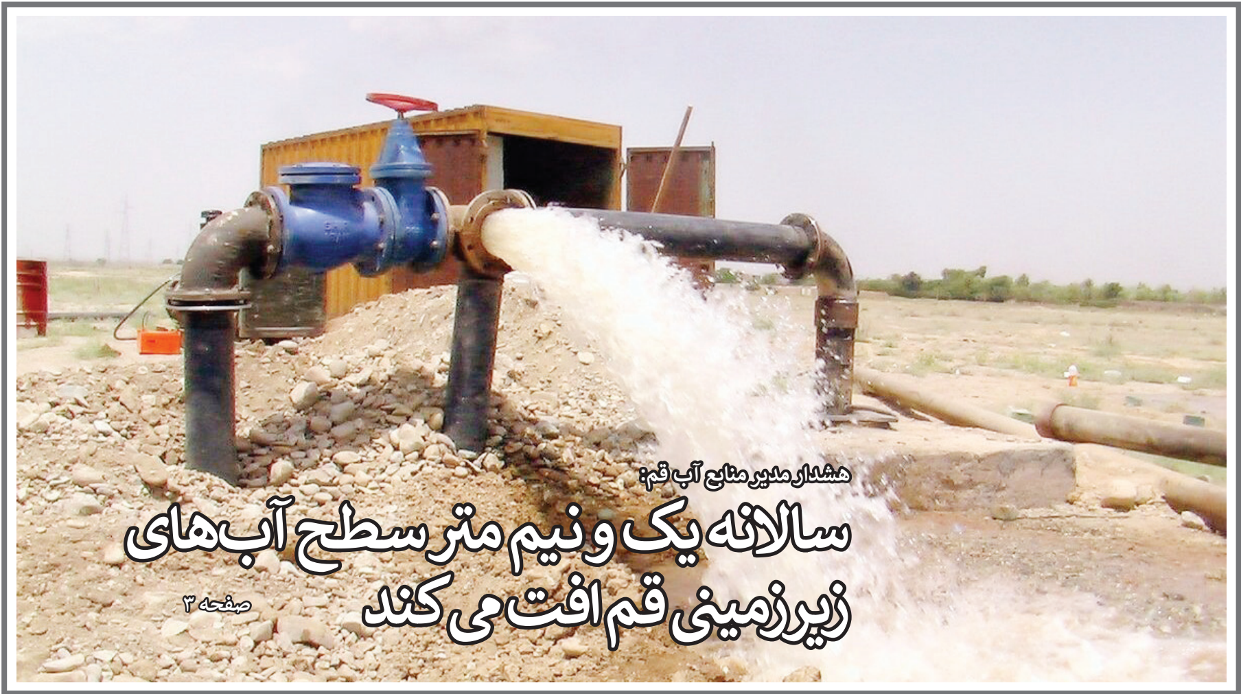
هشدار مدیر منابع آب قم:

سالانه یک و نیم متر سطح آب‌های زیرزمینی قم افت می‌کند صفحه ۳