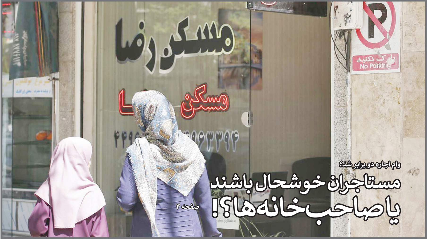
وام اجاره‌دو برابر شد! مستاجران خوشحال باشند یا صاحب‌خانه‌ها؟! صفحه ۳