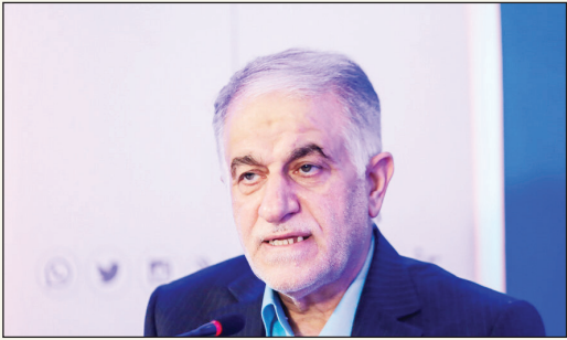
رئیس شورای اسلامی شهر اصفهان

رئیس شورای اسلامی شهر اصفهان گفت: یکی از مشکلات حوزه اتوبوسرانی، کمیود راننده بود که با پیگیری‌های فراوان این مشکل رفع شده است، زمانی ۱۵۰ اتوبوس خریداری شده و بدون راننده مانده بود، اما در حال حاضر تمام اتوبوس‌ها در چرخه سرویس‌دهی قرار دارد.