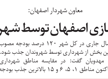
معاون شهردار اصفهان: