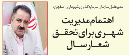
مدیرعامل سازمان سرمایه‌گذاری شهرداری اصفهان اهتمام‌مدیریت شهری برای تحقق شعار سال

استاندار سمنان از اسکان ۲۰۰ هزار نفر در استان طی تعطیلات نوروزی در اماکن اسکان رسمی و غیر رسمی خبر داد. سید محمدرضا هاشمی از اسکان بیش از ۲۰۰ هزار نفر طی تعطیلات نوروزی در استان سمنان خبر داد و ابراز کرد: این اسکان‌ها به صورت رسمی شامل مدارس، غیر رسمی شامل بومگردی‌ها و اضطراری شامل سالن‌های ورزشی و تفریحی بجران ... صفحه ۶