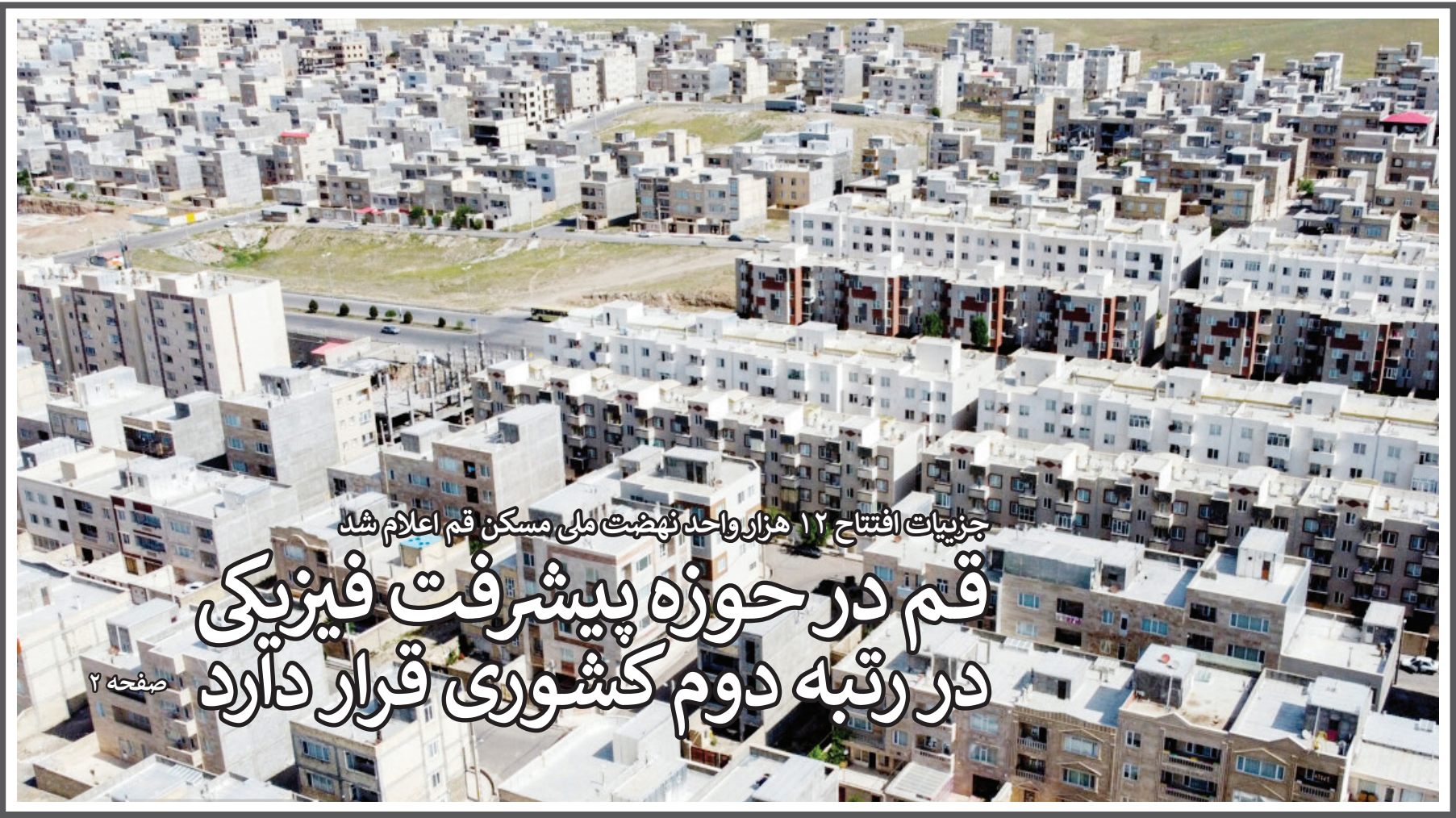
جزئیات افتتاح ۱۲ هزار واحد نهمیت ملی مسکن قم اعلام شد