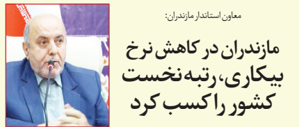
معاون استاندار مازندران مازندران در کاهش نرخ بیکاری، رتبه نخست کشور را کسب کرد