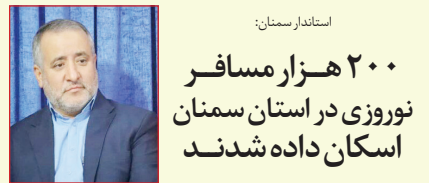
استاندار سمنان ۲۰۰ هزار مسافر نوروزی در استان سمنان اسکان داده شدند