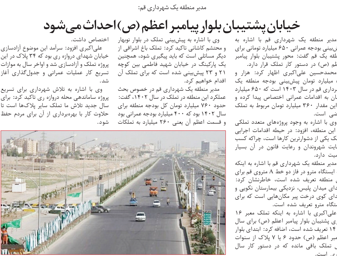
نمای هوایی از بلوار پیامبر اعظم (ص) در خیابان پشتیبان بلوار پیامبر اعظم (ص)